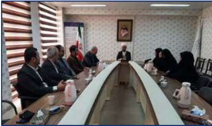
گرامیداشت سالروز تشکیل نهاد گزینش به فرمان حضرت امام خمینی (ره) در دانشگاه ۱۴۰۳/۱۰/۲۹