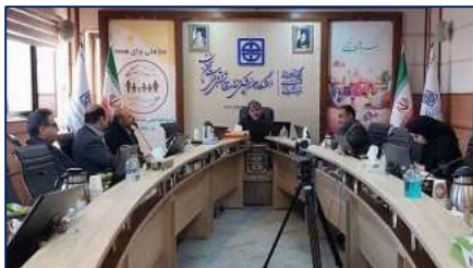
مجوز اولین داروخانه شیانه روزی شهرستان ایوانکی در جلسه کمیسیون ماده ۲۰ امور داروخانه‌ها صادر شد ۱۴۰۳/۱۰/۰۸