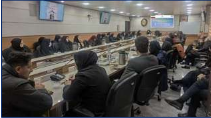
ششمین نشست شورای پیام گزاران سلامت و سومین نشست خانه مشارکت مردم در سلامت زیر مجموعه دبیرخانه سلامت و امنیت غذایی استان سمنان برگزار شد ۱۴۰۳/۱۰/۲۹