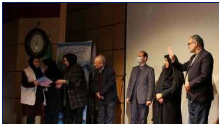
تجلیل از داوطلبان و سفیران سلامت منتخب در مراسم بزرگداشت روز جهانی داوطلب سلامت دانشگاه علوم پزشکی استان سمنان ۱۴۰۳/۱۰/۰۸