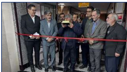
راه اندازی و افتتاح طرح توسعه بخش اورژانس بیمارستان معتمدی گرمسار ۱۴۰۳/۱۰/۱۰